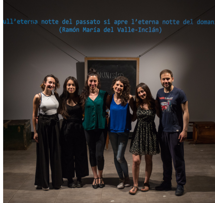
Corso di Teatro in lingua spagnola - Pon