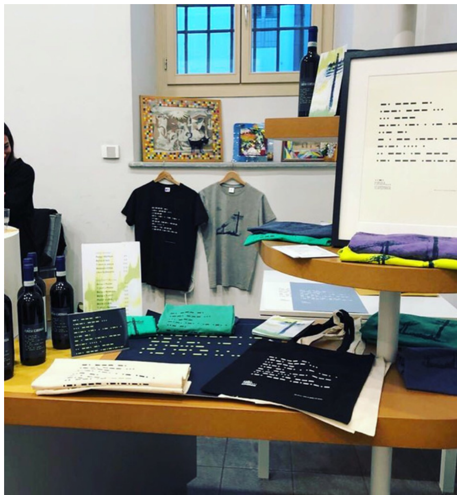
Presentazione di Furiosa Scandinavia al SalTo (2019)