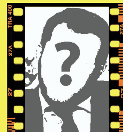
EL PERSONAJE X